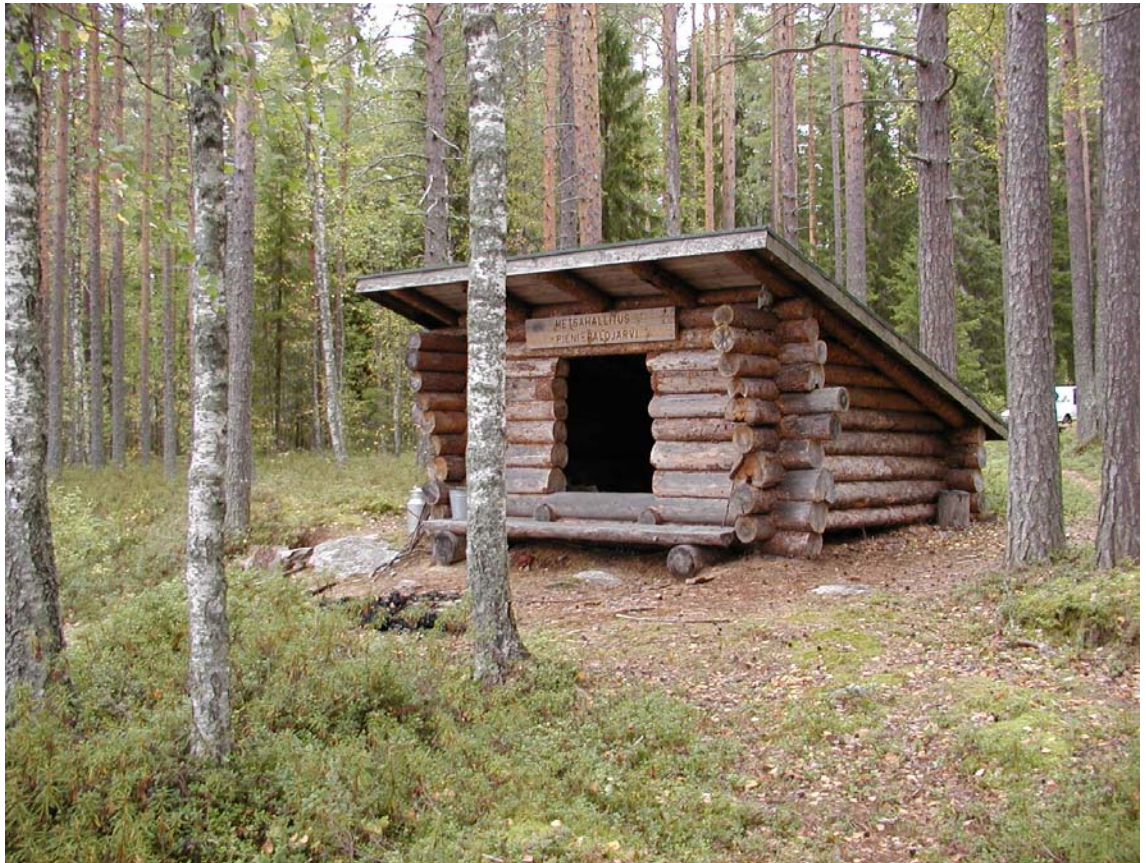
Laavu Pienen Palojärven rannalla

Pienen Palojärven metsä kuuluu Etelä-Suomen vanhojen metsien suojeluohjelman asetuksella perustettavaksi ehdotettuihin valtionmaiden täydennyskohteisiin.