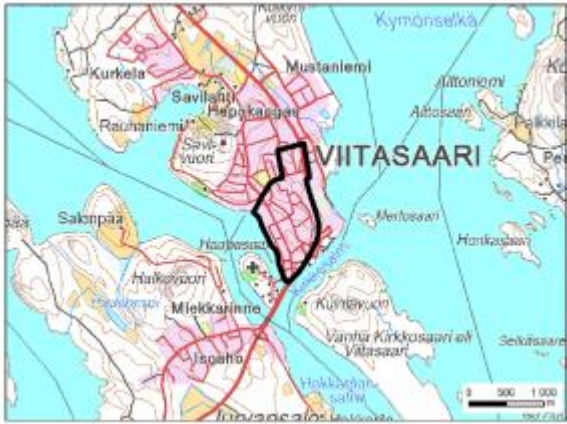
Kuva 3. Keski-Suomen 4. vaihemaakuntakaavan keskustatoimintojen aluevaraus Viitasaarella (Keski-Suomen liiton www-sivut 27.5.2013)

Maakuntakaavassa Viitasaaren keskusta-alue on osoitettu keskustatoimintojen alueeksi (C). Merkinnällä osoitetaan kaupunkitasoisen tai seudullista merkitystä omaavan taajaman keskustatoimintojen ydinalue. Keskustatoimintojen alueella on asutuksen lisäksi hallintoon, palveluihin ja kauppaan liittyviä toimintoja. Vähittäiskaupan suuryksiköiden yhteenlaskettu enimmäiskerrosala on Viitasaaren keskustatoimintojen alueella 20 000 k-m 2 .