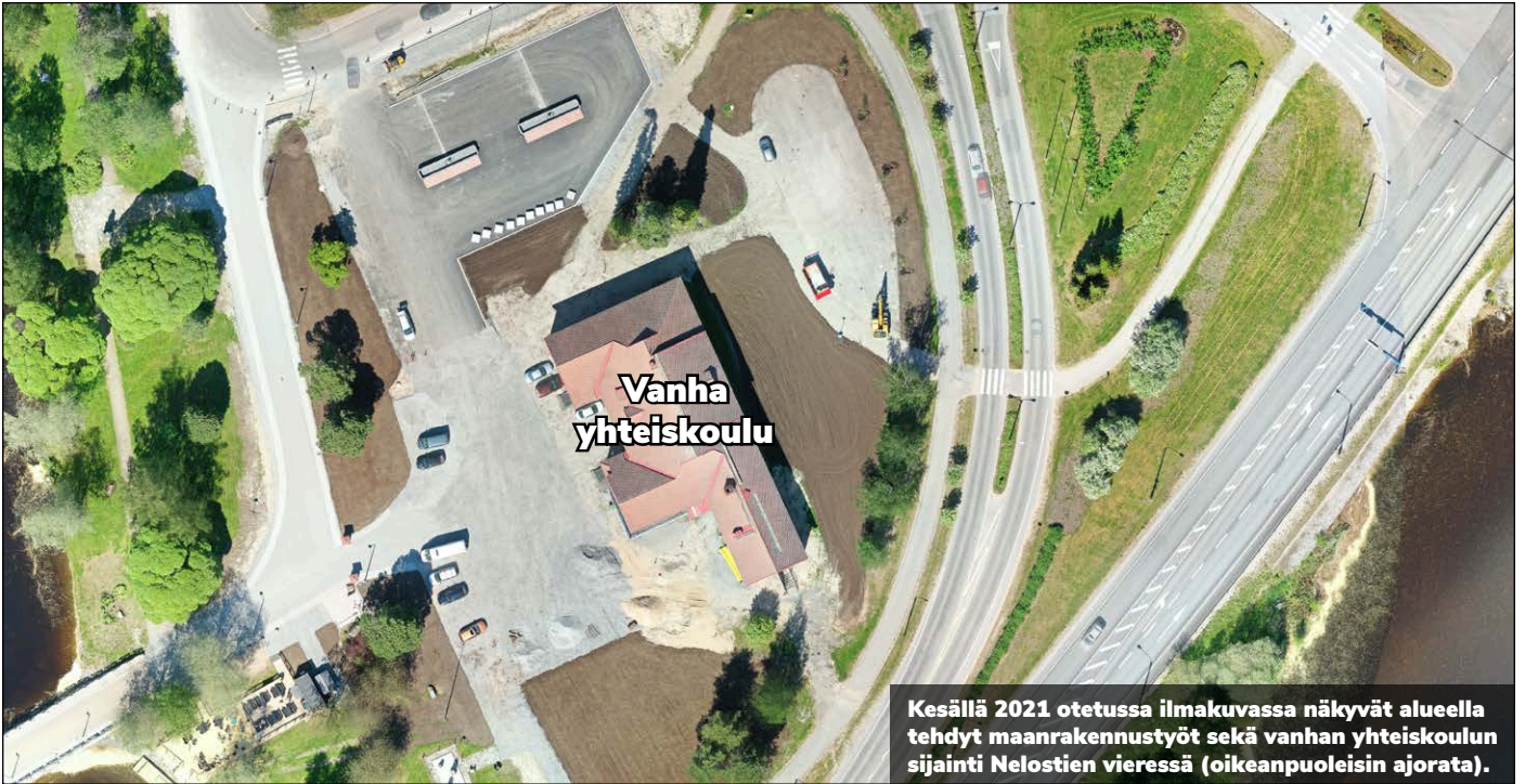
Kesällä 2021 otetussa ilmakuvassa näkyvät alueella tehdyt maanrakennustyöt sekä vanhan yhteiskoulun sijainti Nelostien vieressä (oikeanpuoleisin ajorata).