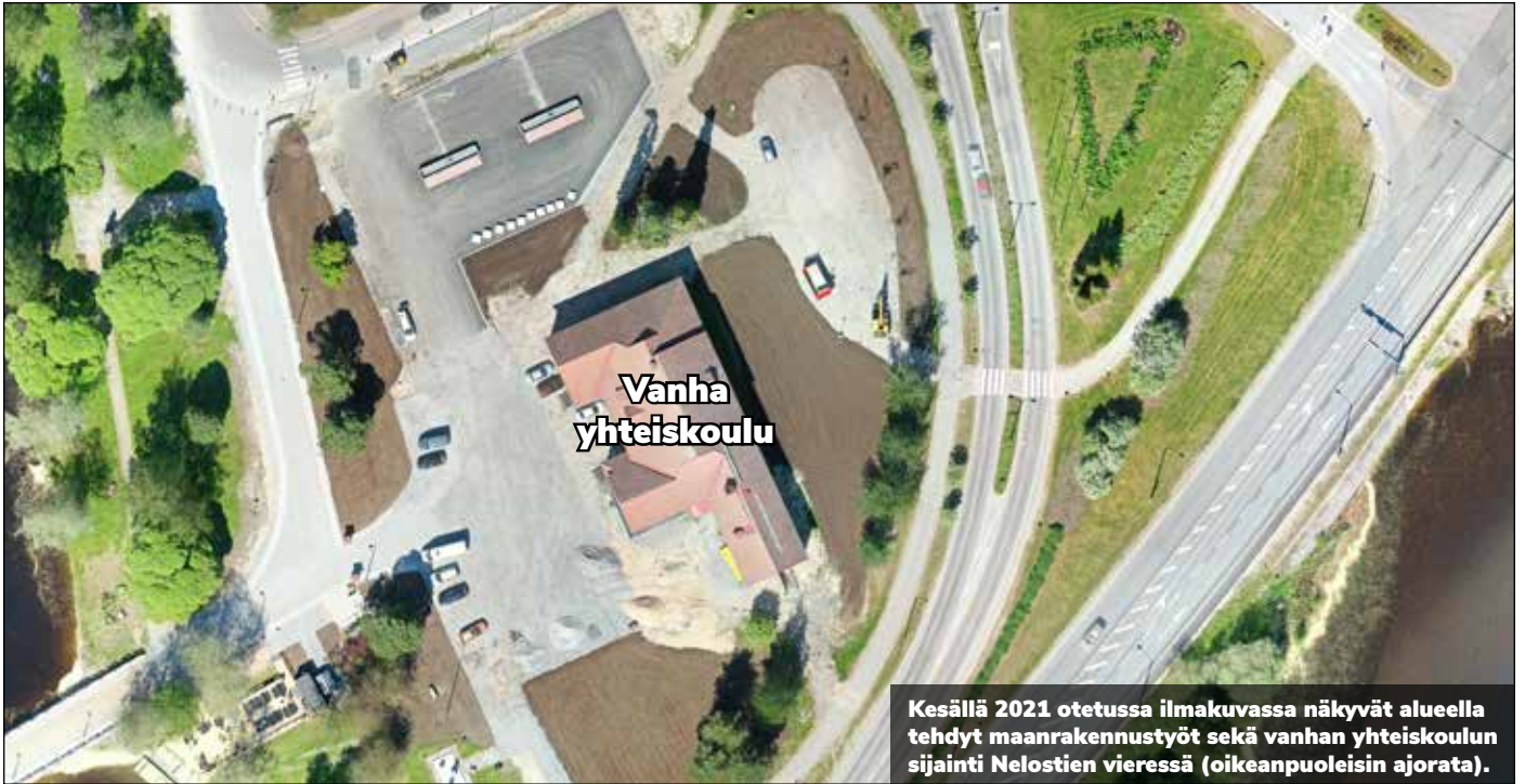
Kesällä 2021 otetussa ilmakuvassa näkyvät alueella tehdyt maanrakennustyöt sekä vanhan yhteiskoulun sijainti Nelostien vieressä (oikeanpuoleisin ajorata).