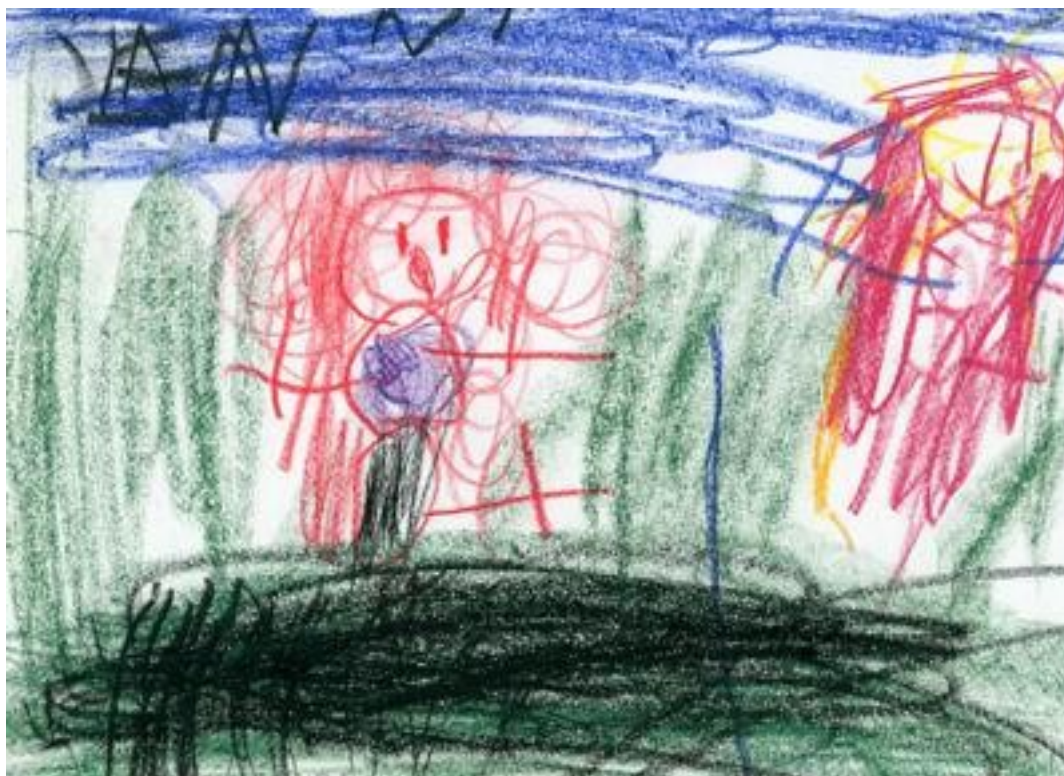
Minä ja paras kaveri

Lasten kulttuurin ja lapsille suunnatun median tunteminen auttaa henkilöstöä ymmärtämään lasten leikkejä. Myös erilaiset pelit sekä digitaaliset välineet ja sovellukset tarjoavat niihin monenlaisia mahdollisuuksia. Leikkiin kannustavassa oppimisympäristössä myös aikuinen on oppija. Henkilöstö keskustelee leikin merkityksestä ja lasten leikkeihin liittyvistä havainnoista huoltajien kanssa. Tällä tavoin voidaan edistää leikkien jatkumista kotona tai varhaiskasvatuksessa.