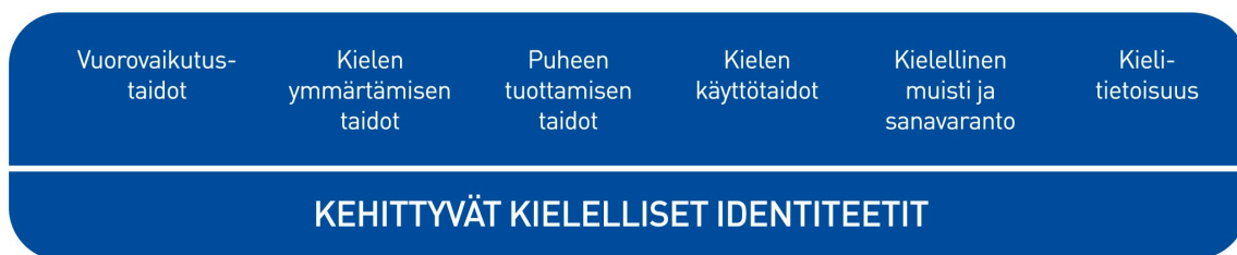
Kuvio 2. Lasten kielen kehityksen keskeiset osa-alueet varhaiskasvatuksessa

Kielen oppimisen kannalta on tärkeää tiedostaa, että saman ikäiset lapset voivat olla eri vaiheissa kielen kehityksen eri osa-alueilla. Kielelliset identiteetit kehittyvät , kun lapsia ohjataan ja tuetaan kielellisten taitojen ja valmiuksien keskeisillä osa-alueilla.