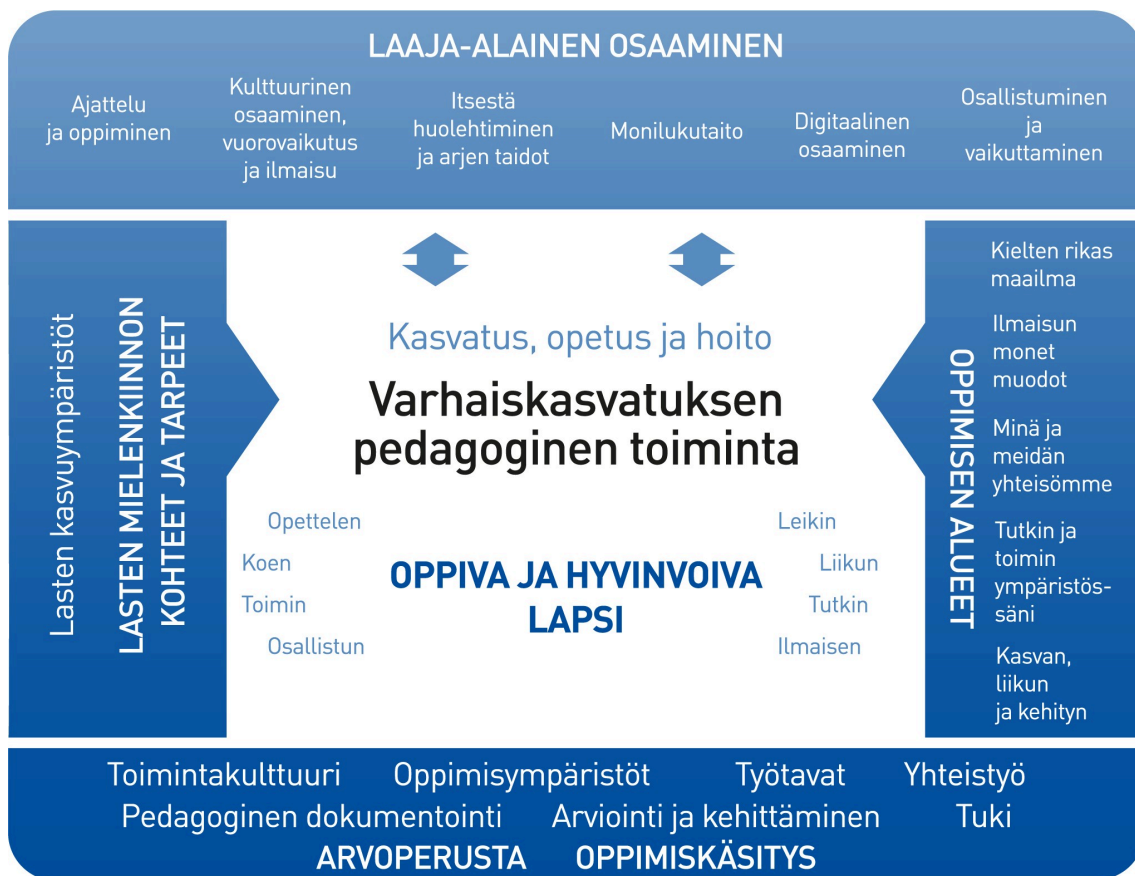
Kuvio 1. Varhaiskasvatuksen pedagogisen toiminnan viitekehys

Varhaiskasvatuksen pedagogista toimintaa ja sen toteuttamista kuvaa kokonaisvaltaisuus. Tavoitteena on edistää lasten oppimista ja hyvinvointia sekä laaja-alaista osaamista (kuvio 1). Pedagoginen toiminta toteutuu lasten ja henkilöstön välisessä vuorovaikutuksessa ja yhteisessä toiminnassa. Lasten omaehtoinen, henkilöstön ja lasten yhdessä ideoima sekä henkilöstön suunnittelema toiminta täydentävät toisiaan. Varhaiskasvatuksen pedagoginen toiminta läpäisee kasvatuksen, opetuksen ja hoidon kokonaisuuden.